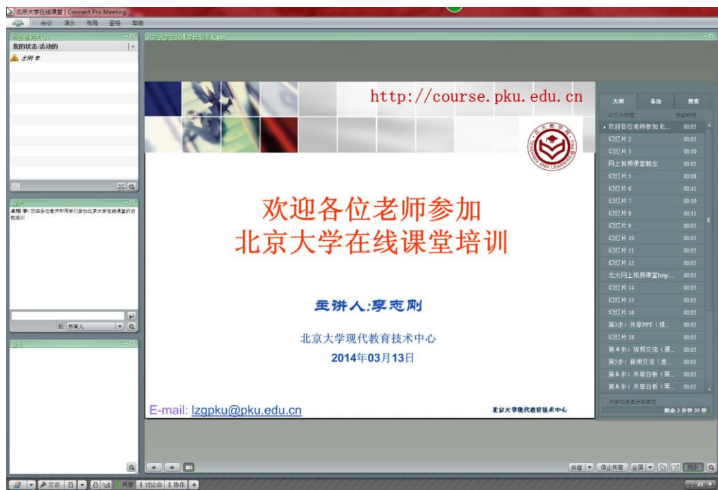
图 1 北京大学在线课堂

它的突出优点是只要您有一台连通网络的计算机就可以随时随地召集分散在各地的教师和学生，创建并进行在线实时教学，及时沟通信息交流心得。教师和学生无需下载安装程序，仅用 IE 浏览器访问在线课堂网址即可开会，可以体验到与传统面授教学不同的方便、快捷和灵活。